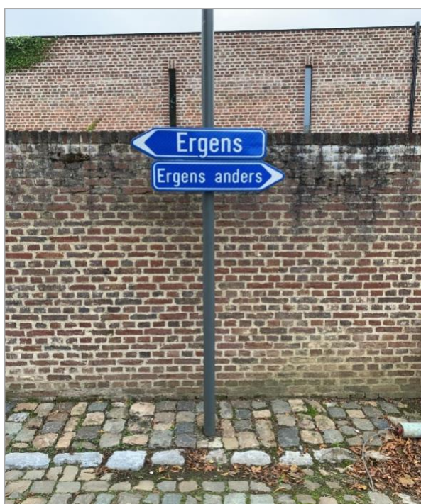
Dilemma in de Kerkdreef in Linden

Ik koos dus maar voor Ergens. Ergens anders kon ik later altijd nog wel naartoe.