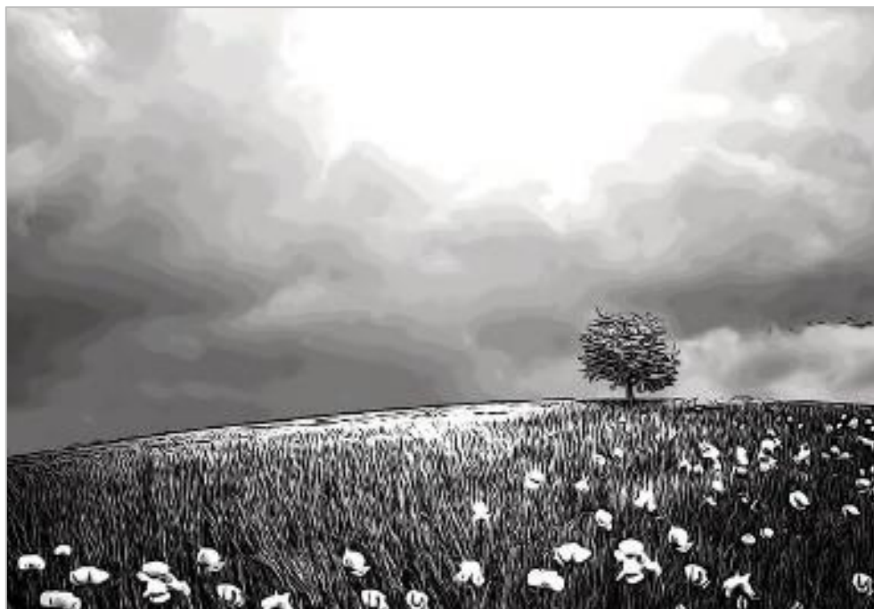
Wilde tuin