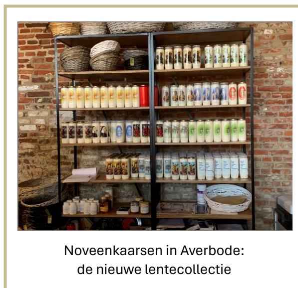
Noveenkaarsen in Averbode: de nieuwe lentecollectie

Maar één ding staat vast: een goede noevenkaars is nooit weggegooid geld, want alle regels van het Vaticaan ten spijt kan zij nog altijd goed dienstdoen wanneer de stroom uitvalt.